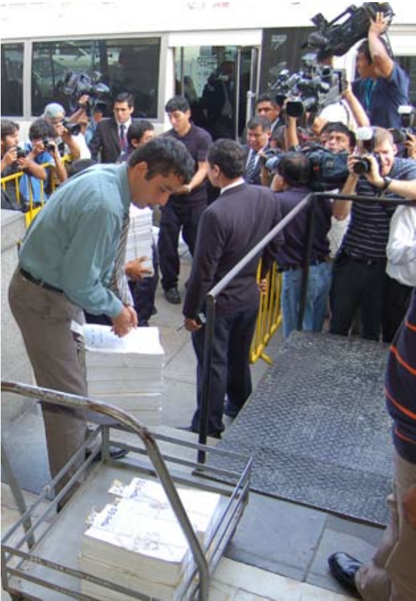
El expediente es trasladado a la Fiscalía en medio de severas medidas de seguridad

Precisó que el 24 de febrero del 2009, según consta en actas, recibió de la Fiscalía aproximadamente 1,300 bienes, y que desde abril de ese año, cada uno de ellos ha sido verificado con presencia de procesados y agraviados.