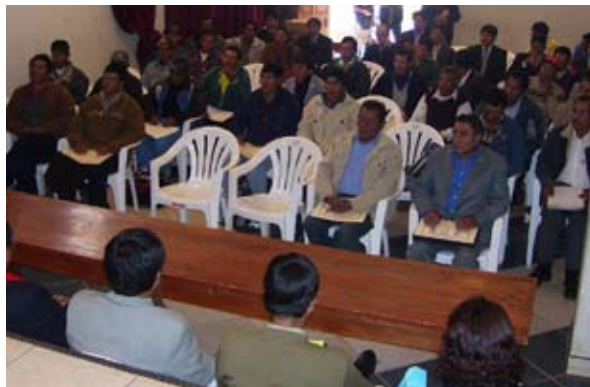
Taller para Jueces de Paz en Cotabambas