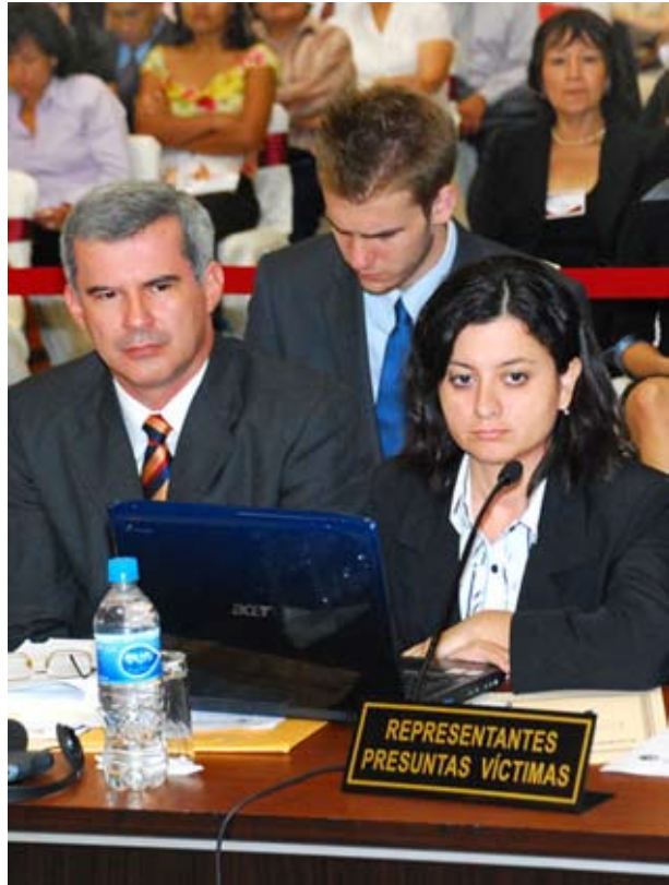
Representantes de las víctimas en el caso Paraguay vs comunidad indígena Xákmok Kásek