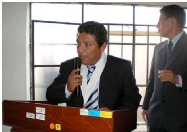
Autoridades judiciales y civiles durante la inauguración del primer Juzgado de Paz Letrado en Chinchao