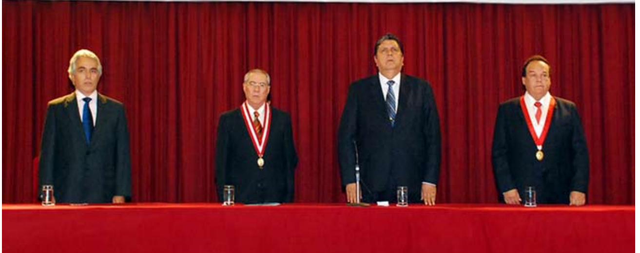
Diego García Sayán, Javier Villa Stein, Alan García Pérez y Luis Alva Castro