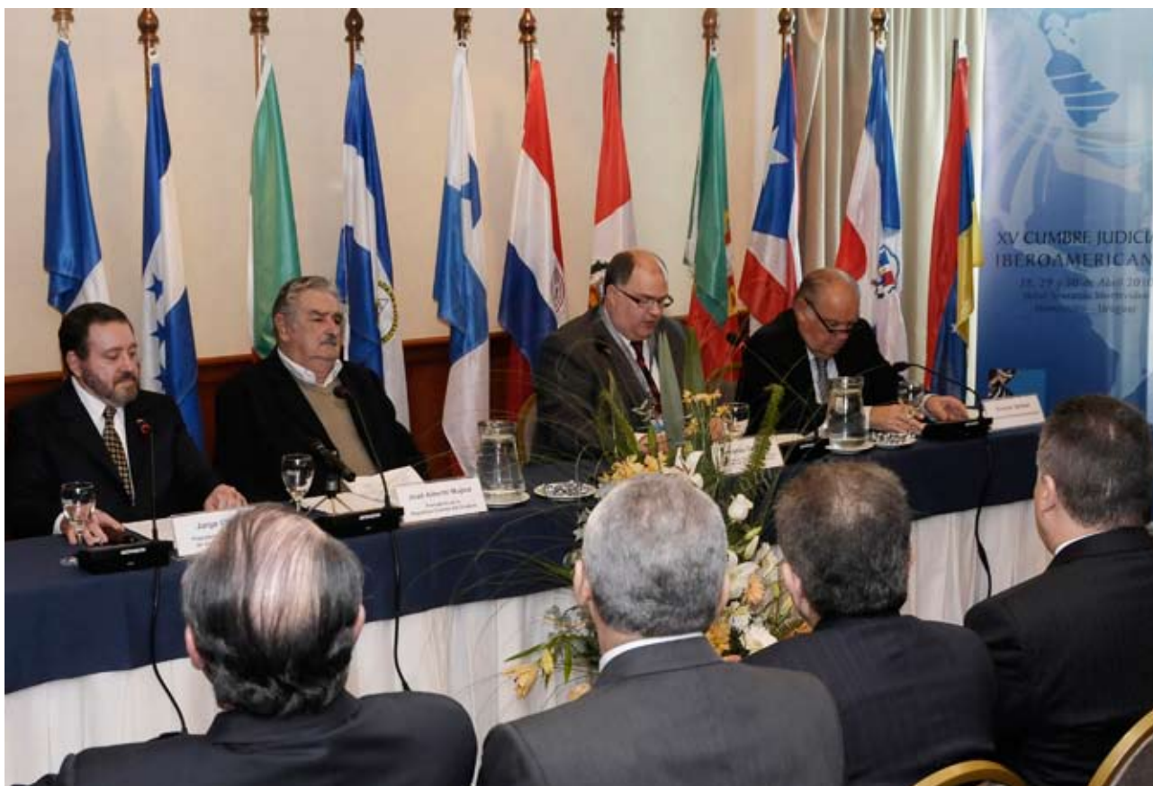
XV Cumbre Judicial Iberoamericana Congregó a más de 180 delegados de 23 países

Además, mostraron las bondades del Terminal de Atención Personal, actualmente instalado en los distritos de Independencia y Chorrillos donde se puede obtener el Certificado de Antecedentes Penales y hacer consulta de expedientes.