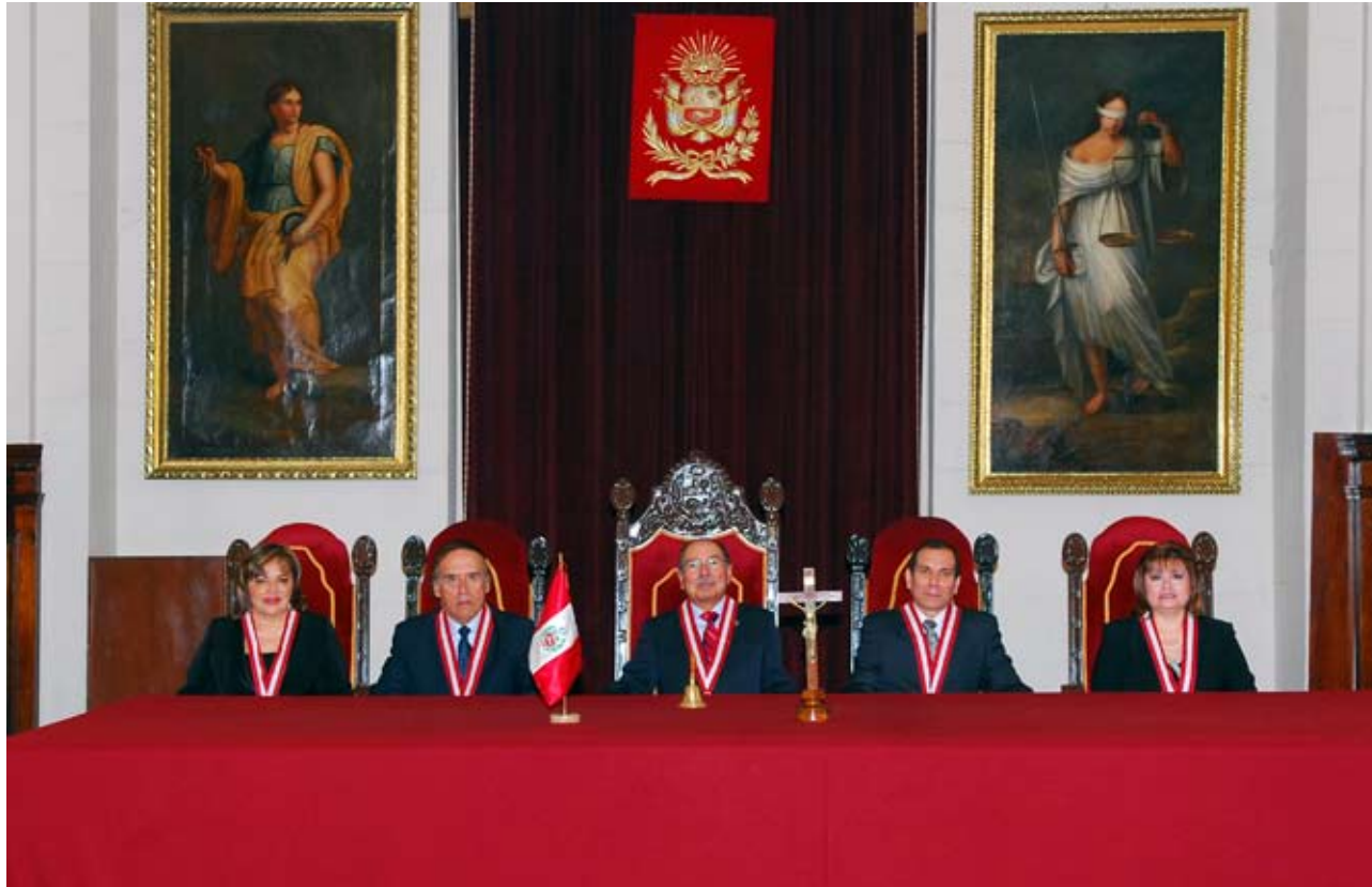
Integrantes de la Sala de Derecho Constitucional y Social Transitoria de la Corte Suprema